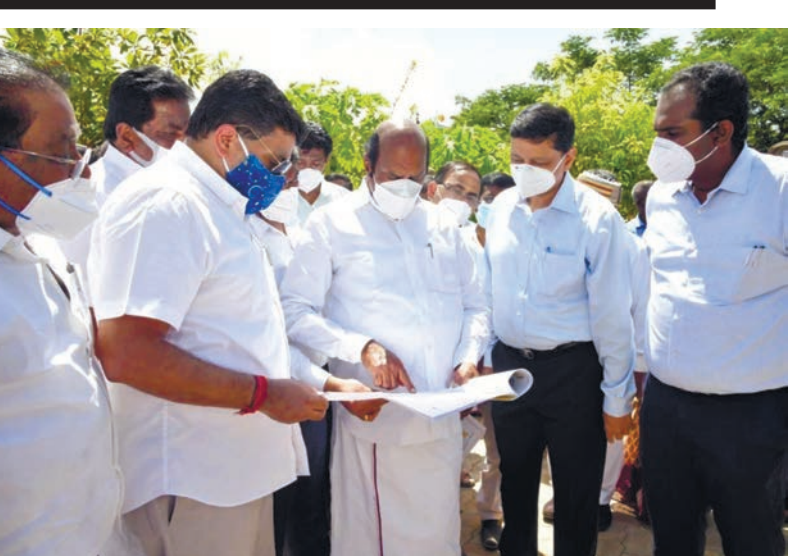
அமர்ந்து படிக்கின்ற வகையில் மிக பிரமாண்டமாக அமையவுள்ளது. முதலமைச்சரின் பார்வையிட்ட ஆறு இடங்களில் நிலை குறித்து தெரிவித்து அவர் தேர்ந்தெடுக்கும் இடத்தில் ஓர் ஆண்டுக்குள் 7 தளங்களை கொண்ட கட்டிடமாக கலைநூர் நூலகம் சிறப்பாக அமையவிரும்புகிறது. முன்னதாக பூங்கா முருகன் கோவிலில் அர்ச்சகர்களுக்கு ரூ.4000 மற்றும் மளிகைப் பொருட்களின் தொகுப்பு அடங்கிய நிவாரண உதவிகளை அமைச்சர்கள் வழங்கினார்கள். அதனை தொடர்ந்து சிம்மக்கல் பகுதியில் உள்ள கருணாநிதியின்

சென்னை, ஜூன் 27- மதுரையில் கலைநூர் நினைவு நூலகம் அமைப்பதற்காக தேர்வு செய்யப்பட்டுள்ள 6 இடங்களை பொதுப்பணித்துறை அமைச்சர் எ.வ.வேலு, ஊரக வளர்ச்சித்துறை அமைச்சர் கே.ஆர். பெரியகருப்பன், வணிகவாி மற்றும் பதிவுத்துறை அமைச்சர் பி.முர்த்தி, மற்றும் நிதி மற்றும் மனிதவள மேலாண்மைத்துறை அமைச்சர் பி.டி.ஆர்.புழைவேல் தியாகராஜன் ஆகியோர் பார்வையிட்டனர். முதலமைச்சர் ஸ்டாலின், கலைநூரின் பிறந்த நாளன்று அண்ணா நூலகம் சென்னையில் அமைக்கப்பட்டுள்ளதைப் போன்று தமிழ் வளர்ந்த மதுரை மாநகரில் கலைநூர் நினைவு நூலகம் அமைக்கப்படும் என்று அறிவித்தார். நூலகம் அமைப்பதற்கு உத்தேசமாக தேர்வு செய்யப்பட்டுள்ள 6 இடங்களை மாட்டித்துவாணி பேருந்து நிலையம் அருகில், உலகத் தமிழ்ச் சங்க வளாகம், சட்டக்கல்லூரி மாணவியர் விடுதி வளாகம், புட்டத்தோப்பு சாலை பகுதி, எல்லை நகர் மீனாட்சி அம்மன் கோவில் தேவஸ்தான இடம், மற்றும் எல்லை நகர் வீட்டுவசதி வாரிய வளாகம் என ஆறு இடங்களை இன்று பார்வையிட்டனர். குறிப்பாக கலைநூர் நூலகம் 2 லட்சம் சதுரடி பரப்பளவில் 24 பகுதிகளாக பிரிக்கப்பட்டு, முழு குளிர்சாதன வசதியுடன் ஓரே நேரத்திலே 600 வாசகர்கள்