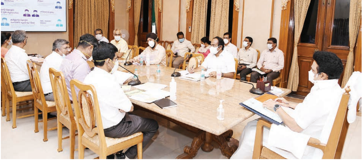
முதலமைச்சர் மு.க. ஸ்டாலின் தலைமையில், தலைமைச் செயலகத்தில், தொழில்துறை செயல்பாடுகள் குறித்து ஆய்வுக் கூட்டம் நடைபெற்றது. இந்தக் கூட்டத்தில் தொழில்துறை அமைச்சர் தங்கம் தென்னரசு, தலைமைச் செயலாளர், நிதித்துறை கூடுதல் தலைமைச் செயலாளர், தொழில் துறை முதன்மைச் செயலாளர், தகவல் தொழில்நுட்பவியல் துறை முதன்மைச் செயலாளர், தொழில்துறை சிறப்புச் செயலாளர் மற்றும் அரசு உயர் அலுவலர்கள் கலந்து கொண்டனர்.

சூடிய லேசானது முதல் மிதமான மழையும் பெய்யக்கூடும். நாளை (28-ந் தேதி) கடலோர மாவட்டங்கள் மற்றும் சென்னை, புதுவை, காரைக்கால் பகுதிகளில் ஒரு இடங்களில் இடிமின்னலுடன் கூடிய லேசானது முதல் மிதமான மழை பெய்யக்கூடும். 29 மற்றும் 30-ந் தேதிகளில் மேற்கு தொடர்ச்சி மலையை ஒட்டிய நீலகிரி, கோவை, தேனி, திண்டுக்கல், கென்காசி மாவட்டங்கள் மற்றும் அதனை ஒட்டிய உள் மாவட்டங்களில் ஓரிரு இடங்களில் லேசானது முதல் மிதமான மழை பெய்யக்கூடும். ஜூலை 1-ந் தேதி அன்று நீலகிரி, தேனி, திண்டுக்கல் மாவட்டங்களில் ஓரிரு இடங்களில் கனமழையும், ஏனைய மேற்கு தொடர்ச்சி மலையை ஒட்டிய கோவை, தென்காசி மாவட்டங்கள் மற்றும் அதனை ஒட்டிய உள் மாவட்டங்களில் ஓரிரு இடங்களில் லேசானது முதல் மிதமான மழையும் பெய்யக்கூடும். சென்னையை அடுத்த 24 மணி நேரத்திற்கு வரம் பொதுவாக மேகமூட்டத்துடன் காணப்படும். நகரின் சில இடங்களில் இடிமின்னலுடன் கூடிய லேசான மழை பெய்யக்கூடும். கடந்த 24 மணி நேரத்தில் அதிகப்பட்சமாக நடுவட்டம், ஏற்காடு, மேலாளத்தூர், ஜெயங்கொண்டம், கெங்கல்வல் ஆகிய இடங்களில் தலா 2 செ.மீ. மழையும், குரூர், திருப்பூண்டி, சின்னக்கல்லூர், போளூர், வேப்பந்தட்டை, திருப்பத்தூர் ஆகிய இடங்களில் தலா 1 செ.மீ. மழையும் பதிவாக உள்ளது.