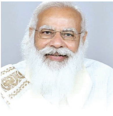
தமிழ்மொழி கல்ச்சாரத்தின் பெரிய அபிமானி நான்

‘மன் கி பாத்’ நிகழ்ச்சியில் பிரதமர் மோடி அறிவுறுத்தல்